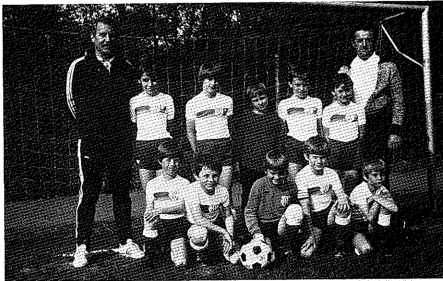
Die E-Schüler Meister-Mannschaft